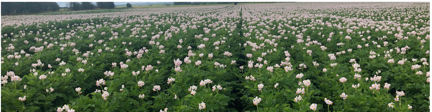
Fyone i blomst

Udbyttet i Fyone er over udbyttet i Kuras. Det viser forsøg i flere år både på den lette jrb1 jord i Midtjylland og på Nordjysk sandjord ved Dronninglund. Erfaring tyder på, at sorten også klarer sig godt under uvandede forhold. Stivelsesprocenten er middel, og udover en særdeles høj skimmelresistens har Fyone resistens mod den almindelige kartoffelbrok type 1. Skal der nævnes svagheder ved Fyone, så kan den danne hule knolde, og den er langsom til at blive skindfast. Det sidste betyder, at den formodes at være mindre egnet til lagring i hus, hvor tørring kan tage for lang tid. Fyone har et relativt lavt N-behov.