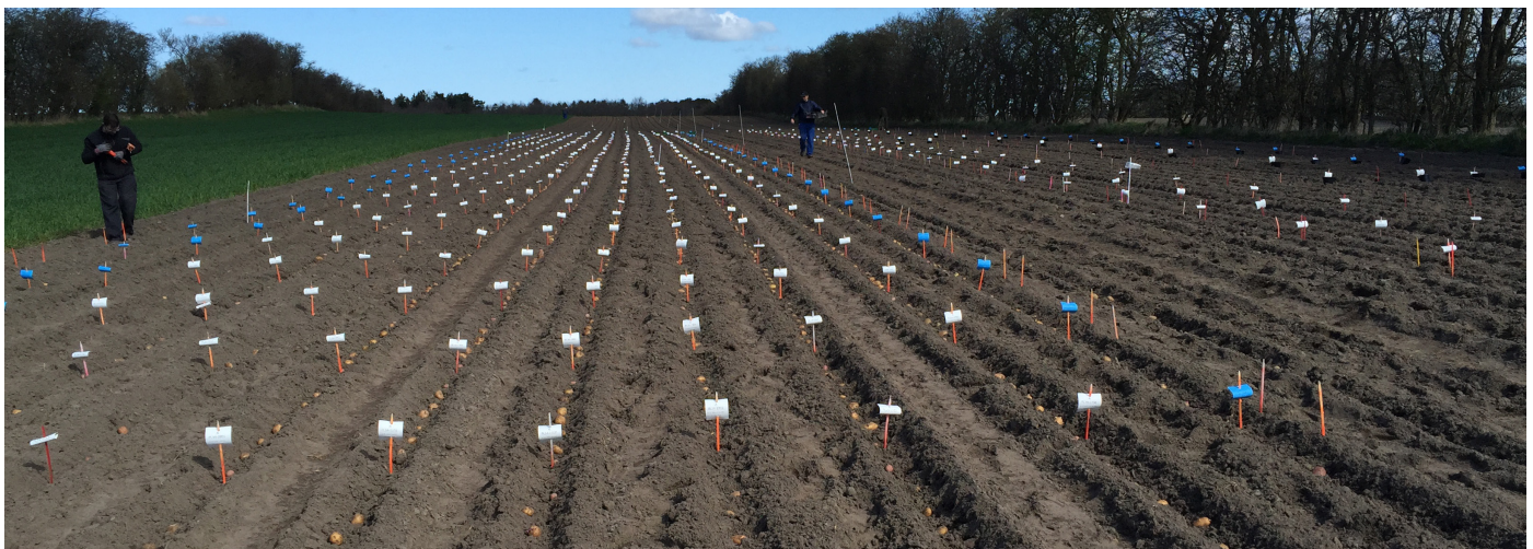
Lægning i forædlingsmarken

AKV fik Nofy på sortlisten i 2017, og Fyone er kommet med i år. De to første sorter har kun et enkelt gen for skimmelresistens, men i fremtidens kloner er der mulighed for 2 eller flere resistensgener. Så vi håber, at vi ser ind i en lovende fremtid med flere nye sorter på listen.