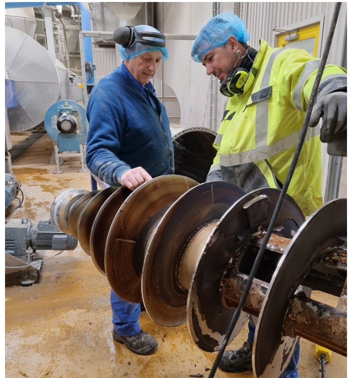
På rengøringsdage er der tid til at få serviceret dele af anlægget

Udover samarbejde er det også vigtigt at få en god start på opgaven. "Det er vigtigt at komme med en positiv stemning. Det betyder meget. Er vi ikke positive, så får vi ikke alt den information, vi skal