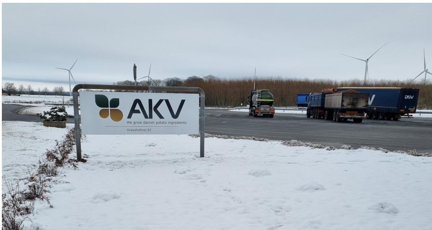
Velkomstsiltet ved vejen er skiftet ud