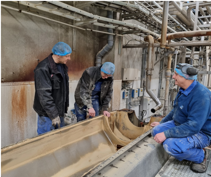
Altid godt at få et ekstra sæt øjne på opgaven

Opsummerende bliver teknisk afdeling kort forklaret således: "Det er os der skal løse problemet, lige meget hvad der er, så er det os folk kommer til. I det overordnede billede er det os, der servicerer alle afdelinger i virksomheden".