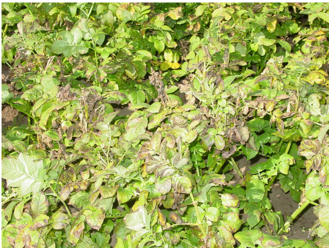
Kaliummangel i kartofler