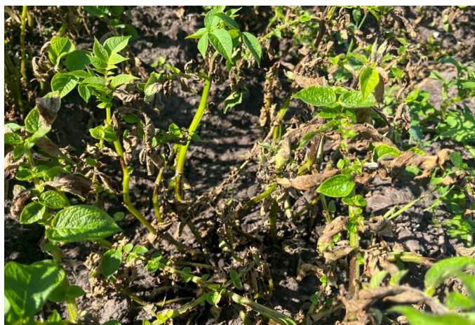
Skimmelangreb den 28. juni 2024

Fyone har en rigtig god modstandskraft mod skimmel. Men desværre og overraskende så vi omkring 8.-12. juli ret kraftige angreb af skimmel i tre marker med Fyone. Vi antager, at der her også har været forekomst af jordsmitte, som har startet angreb på Fyone omkring tidspunktet for fremspiring, hvilket er et tidspunkt, hvor planternes modstandskraft er meget lille (resistensen bygges op ved påvirkning fra sollys). Det skal bemærkes, at to af de tre tilfælde af skimmel i Fyone er i marker, der er nabo til de før omtalte Kuras-marker med meget tidlig skimmel, og at angrebene i Fyone optræder ca. 2-3 uger senere end i Kuras. De første