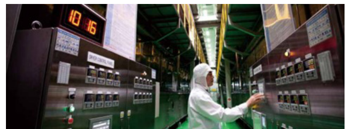
Fødevarer sikkerhed og kvalitet fylder meget

Kartoffelstivelsen er traditionelt den foretrukne, men også dyreste type stivelse til formålet, hvorfor kartoffelstivelsen over tid ofte er blevet erstattet af billigere majs- og hvedestivelse. Det gælder dog ikke i samme grad i de fødevareremballager, hvor emballagen er i direkte kontakt med fødevarer. Her værdsættes det, at kartoffelen modsat hvede er glutenfri, ligesom kartoffelen afgiver mindre smag til fødevarer end majsstivelse.