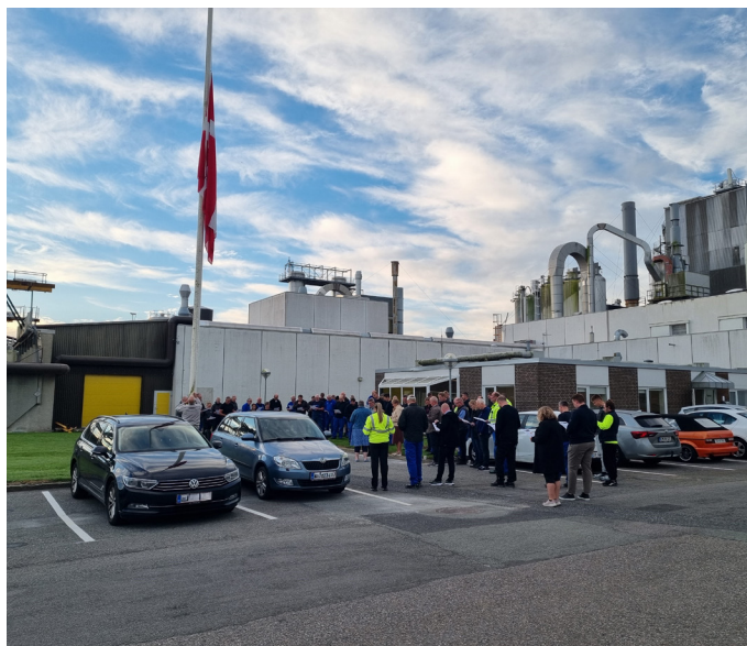
Traditionen tro blev flaget hejst med sang ved kampagnestart